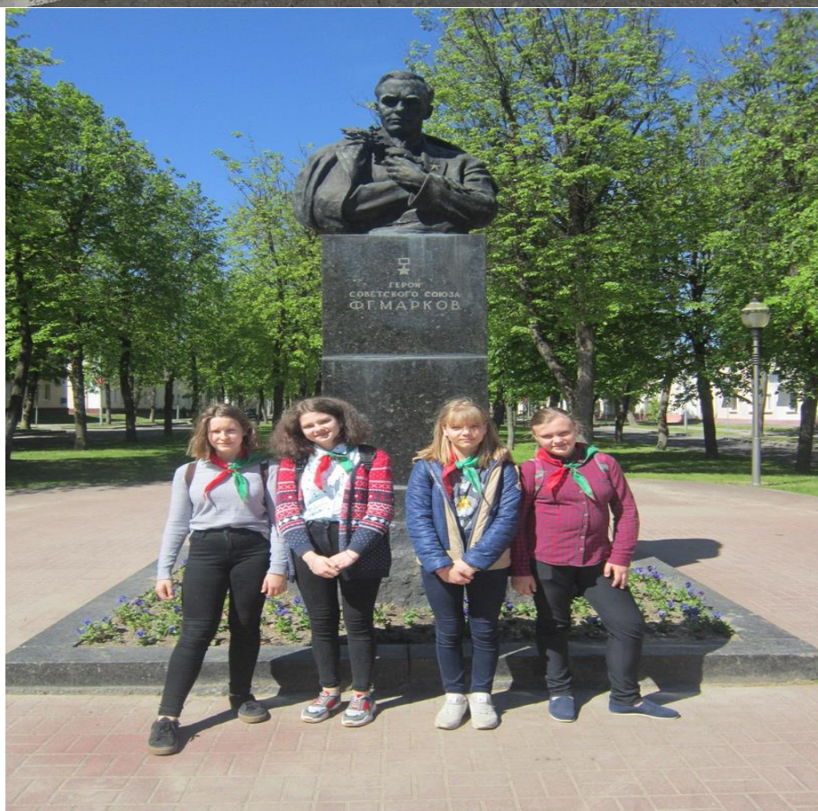
У памятника Маркова