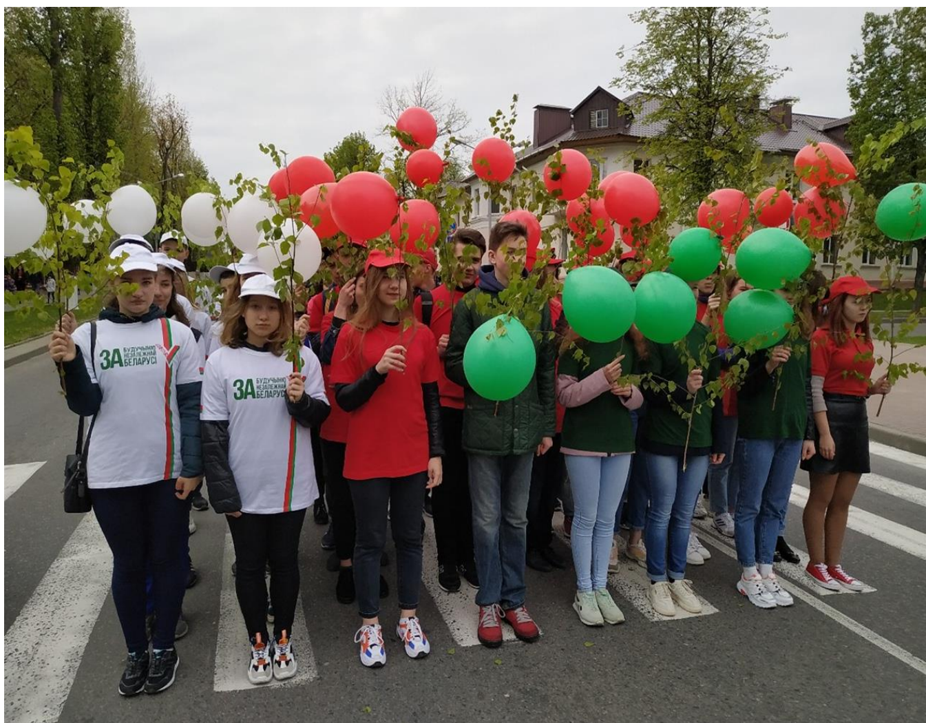
Фото архив улица Машерова